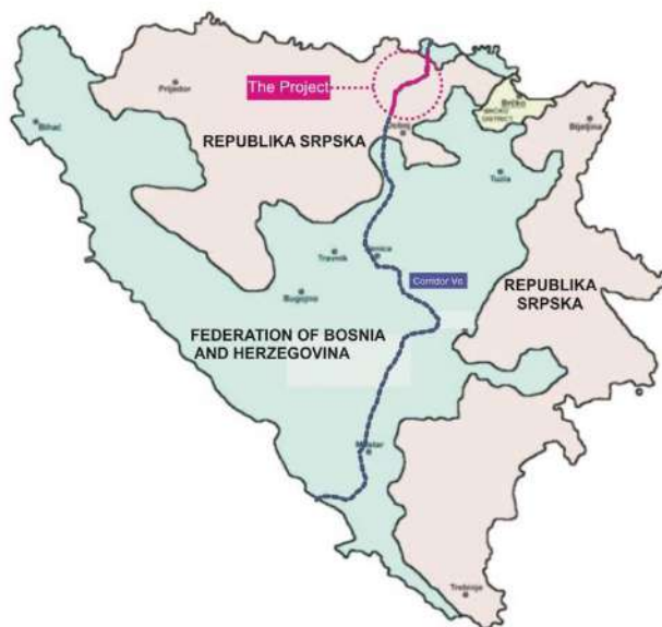
Слика 1: Локација Пројекта 1

Северни део предложене трасе почиње у општини Вукосавље, око 6 км северно од града Модриче. Траса пролази кроз широку равницу претежно обрадивог земљишта. Након петље Вукосавље, траса улази у алувијалну раван реке Босне и остаје у равници до краја. Петља Вукосавље биће и веза са будућим аутопутем Вукосавље – Брчко – Бијељина – граница са Србијом, за који је тренутно у току експропријација, али то није саставни део Пројекта и није обрађено у овом документу.