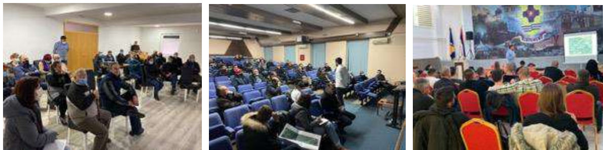
Слика 3: Састанци са локалним становништвом у Вукосављу, Модричи и Добоју (16-18.11.2021)3

Током те исте седмице у новембру 2021. године, консултантски тим се састао и са представницима органа управе у Добоју и Модричи и 11 особа чије је земљиште експроприсано или је у процесу експропријације за потребе Пројекта. Консултантски тим је од надлежних органа добио податке о тренутној ситуацији експропријације земљишта у све три општине, као и детаље везане за процес експропријације, како би их могао упоредити са захтевима ЕИБ-а. У разговору са власницима земљишта, консултантски тим их је питао за њихово виђење процеса експропријације, како су користили земљиште (или да ли га је неко други користио из њиховог домаћинства или је дато под закуп), да ли имају друго земљиште на располагању за коришћење, колико је предметно земљиште важно за њихове изворе прихода, да ли планирају куповину новог земљишта и ако да, да ли ће моћи да купе друго земљиште за надокнаду која им је понуђена или коју траже на суду, итд.