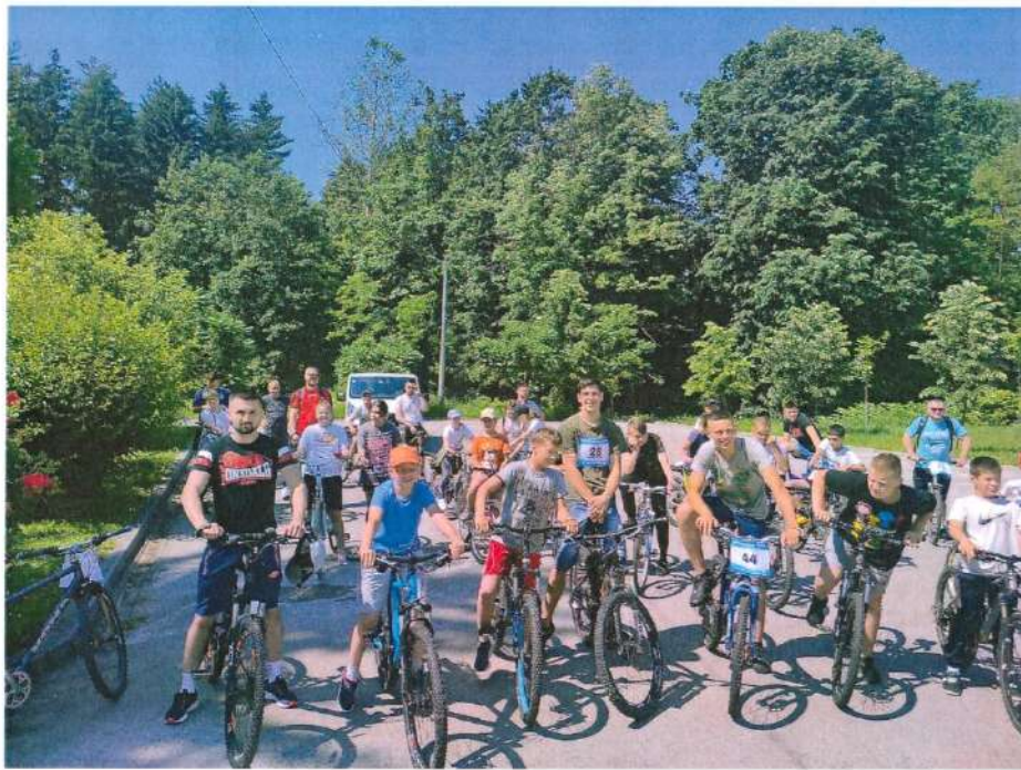
Бициклијада 2023- полазна тачка од Административног центра општине

Манифестација која је постала традиционална на подручју наше општине, а која пружа прилику да прикажемо еколошки и здравствени значај вожње бицикла, као и могућност за провођење више времена у природи и на свјежем zraku.