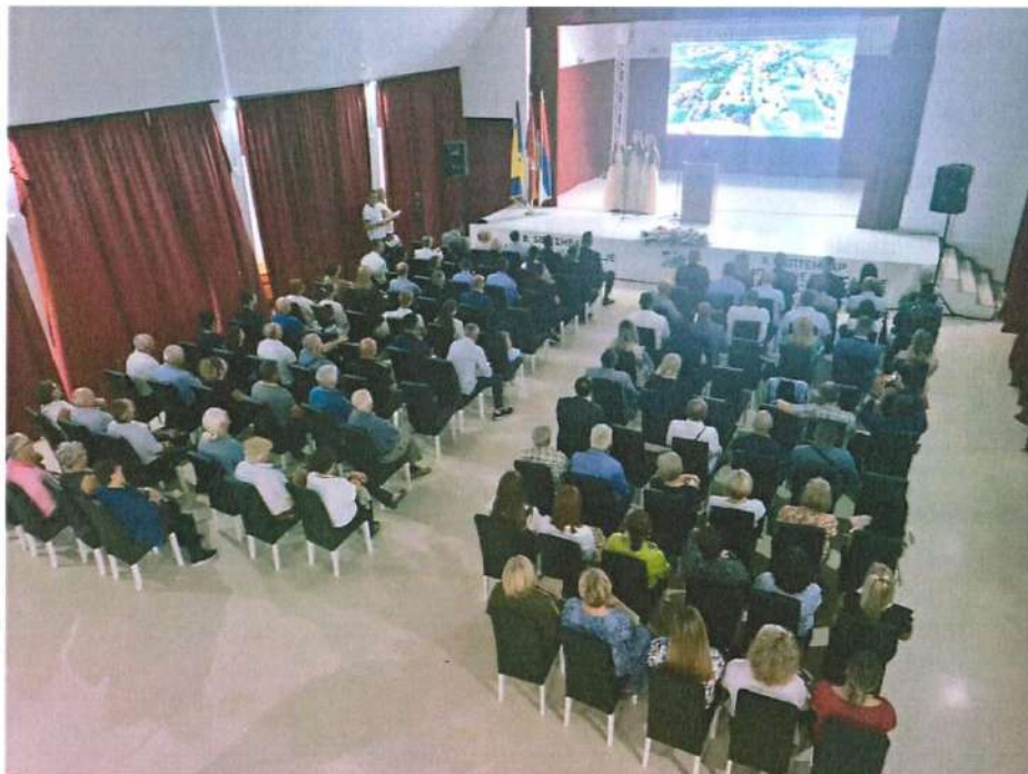
Друштвени Дом Јакеш- Свечана сједница Скупштине општине Вукодавље

За свечану сједницу Дана општине Вукодавље, ЈУ Центар за културу имала је обавезу техничког организатора, те смо у обиљежавању овог важног датума учествовали у припреми културно-забавног програма.