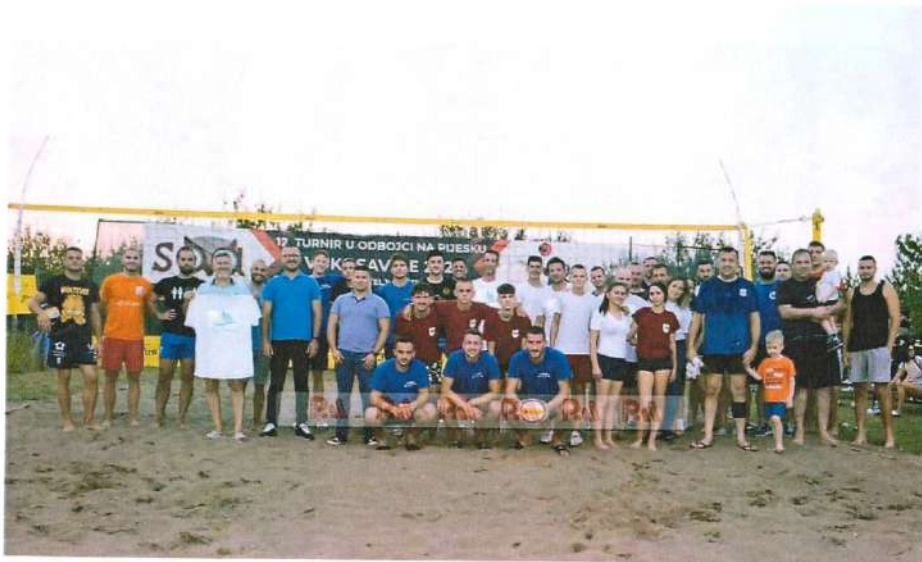
Заједничка фотографија учесника Турнира у одбојци на пијеску- Вукодавље 2023

Турнир су организовали УГ“СОБА“ и ЈУ Центар за културу Вукодавље.