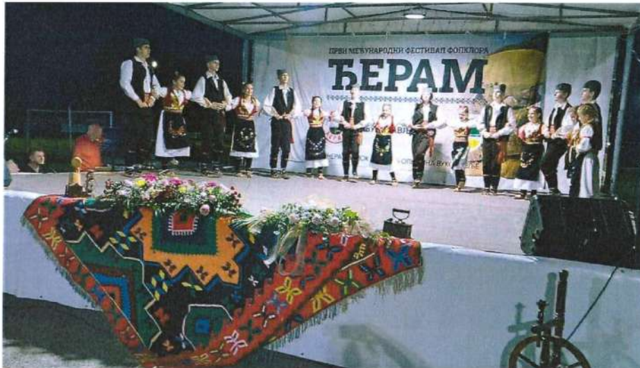
Наступ секције КУД-а „Посавина“ Вукодавље на Међународном фестивалу фолклора „Берам- чувари традиције“ у Вукодављу