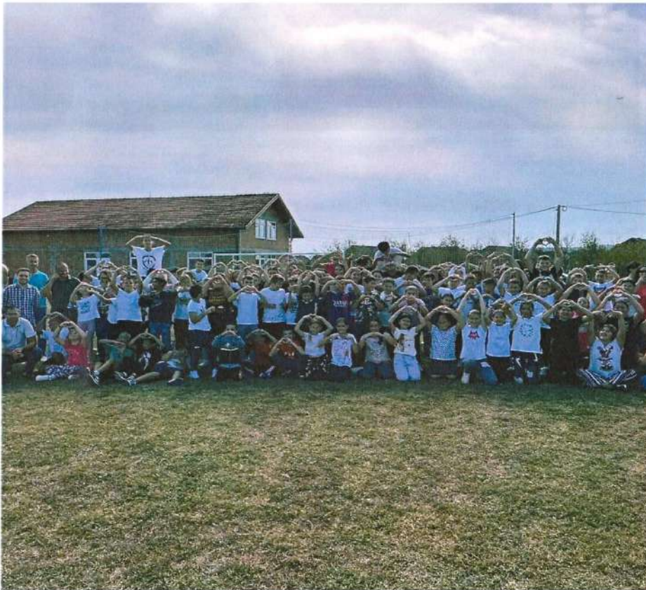
Заједничка фотографија учесника Спортског дана на Фудбалском терену у Јакешу

Спортски дан је представљао сумирање свега онога што је спортски клуб „МД Клинци“ радио у Вукодављу са полазницима школе спорта.