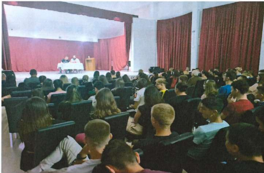
Друштвени Дом Јакеш- Представа „Сумњиво лице“

Представу је погледало око 120 ученика СШЦ „Никола Тесла“ Вукодавље, а одиграна је 6. септембра у сали Друштвеног дома у Јакешу.