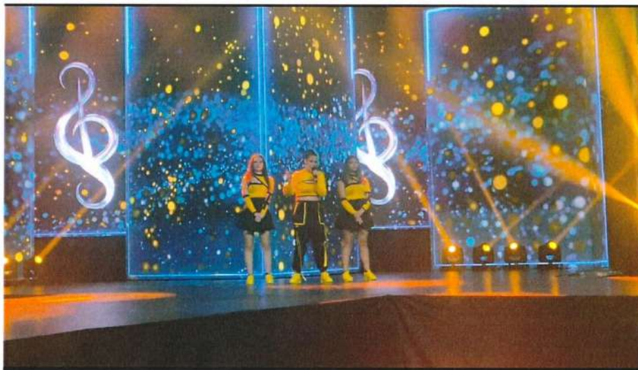
„Ритам Европе“ - Генерална проба пред ТВ пренос