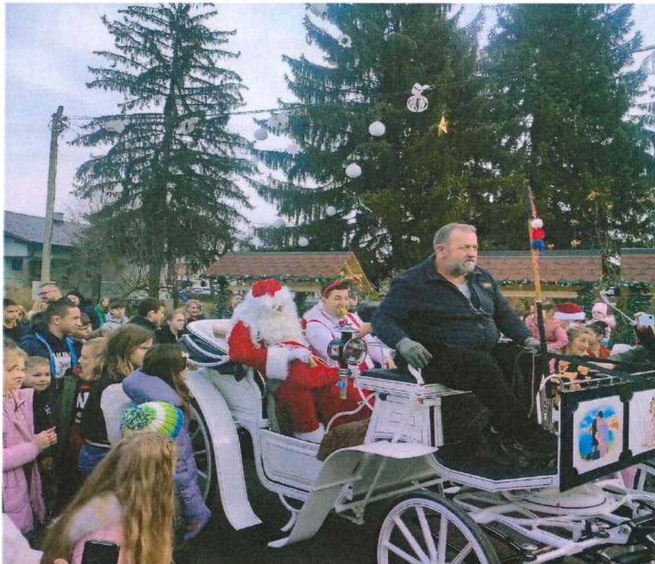
Дочек Дједа Мраза на прослави Дјечије Нове године у Вукодављу

Дјечија Нова година одржана је 30. децембра на платоу Административног центра општине. Уз бога забавни програм подијељено је 300 пакетића за наше најмлађе суграђане.