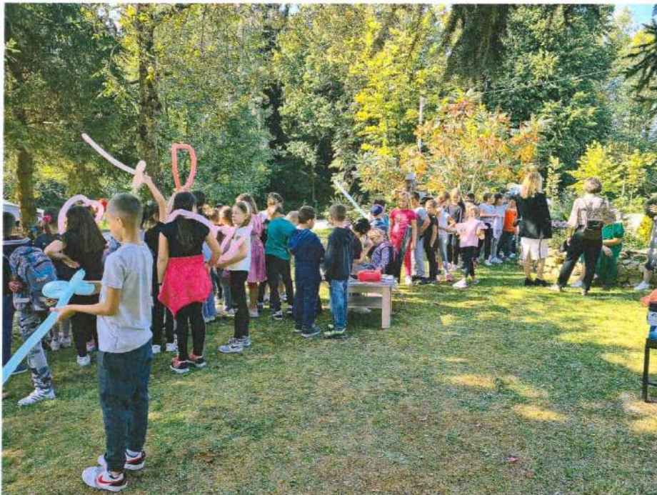
Плато Административног центра општине- обиљежавање Дјечије недјеље

Овом приликом је и свечано отворено обиљежавање Дјечије недјеље.