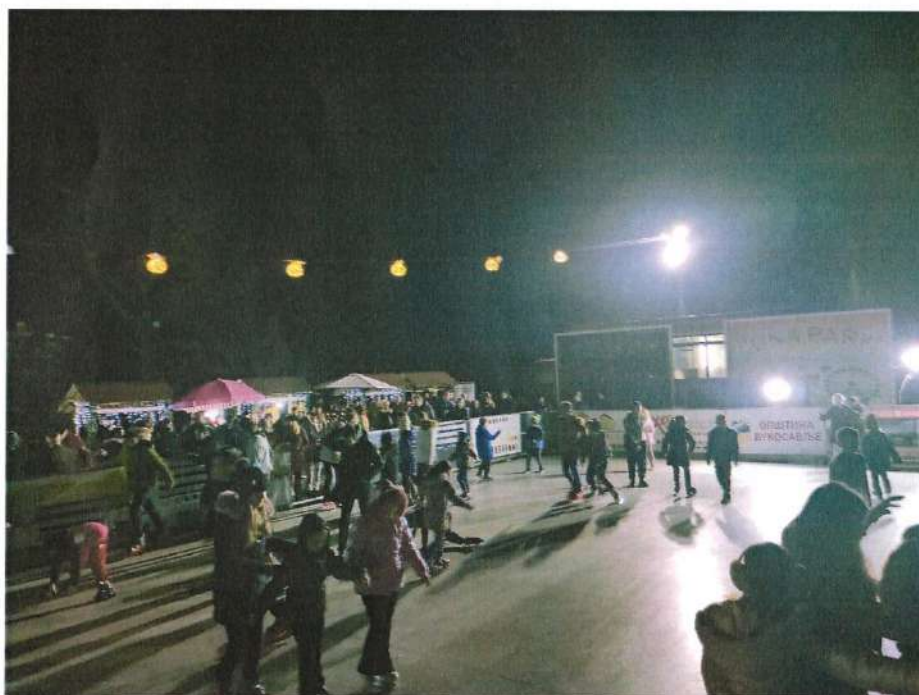
Клизалиште на манифестацији „Зимска идила“ у Вукодављу

Од 14.-18. децембра на Платоу Административног центра општине постављено је клизалиште које је било бесплатно за све заинтересоване. Поред тога имали смо и сајамску понуду штандова са разноврсним производима.