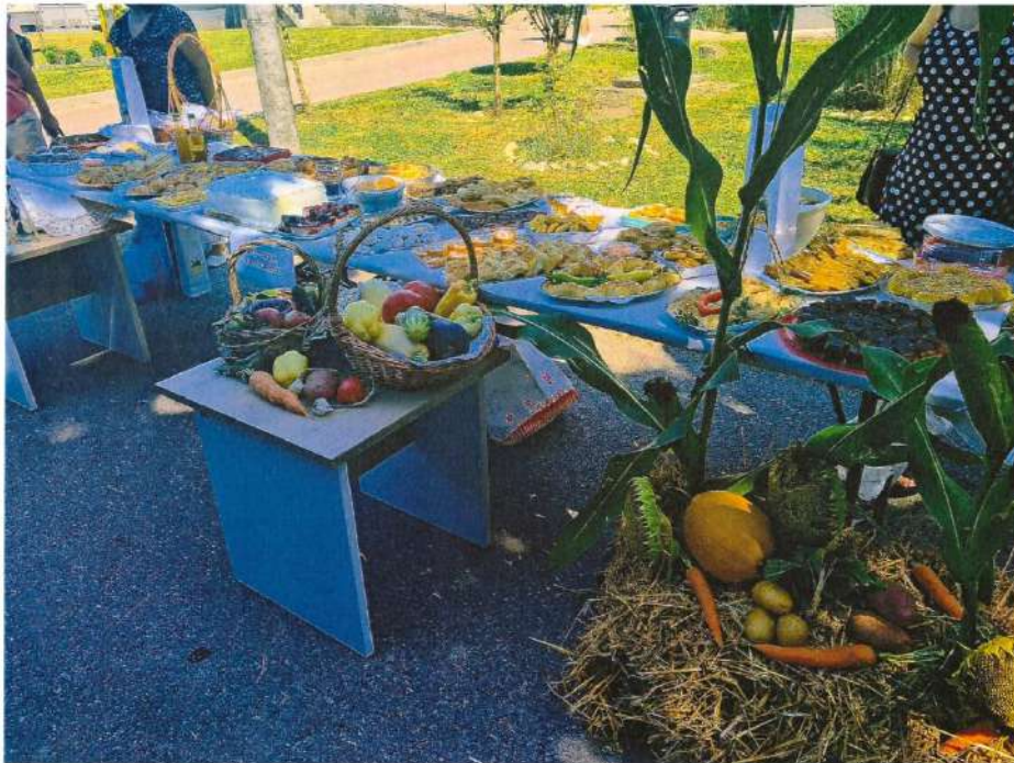
Гастросусрети 2023- Излагачки штанд општине Вукодавље

Похвале посјетилаца као и жеља излагача који су учествовали по први пут на овој манифестацији да посјете Вукодавље и у 2024. години довољна је да кажемо да је ово још једна манифестација чија је организација остварила свој циљ.