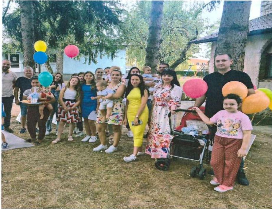
Плато Административног центра општине - „Конференција беба“ 2023