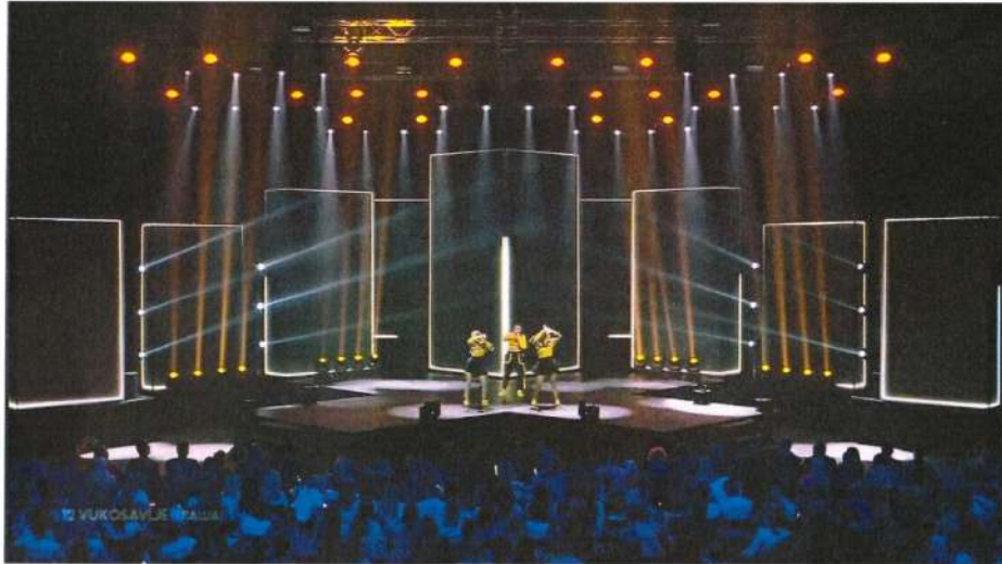
„Ритам Европе“ - детаљ са ТВ преноса финала- наступ Вукодавља