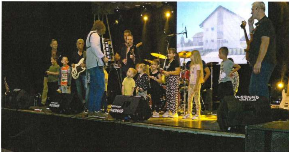
Концерт у Вукодављу- наступ оркестра „Стара прича“

Највећем забавном догађају на подручју наше општине присуствовало је око 1.000 посјетилаца.